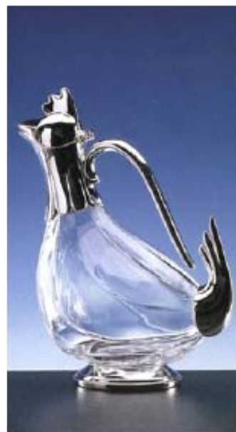
Coq Art. 114-02