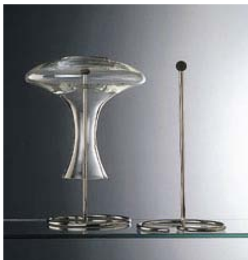
Egouttoir porte-carafe en acier inox Art. 120-00