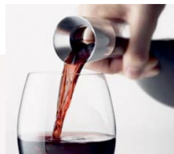
Carafe à vin Menu™